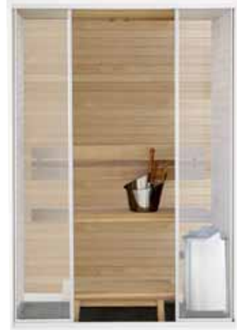
Capella-mallin SC1409 vakiotoimitussisältö